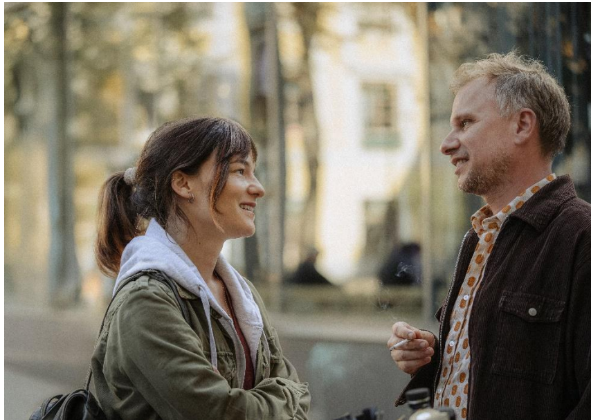
Barbara (Valerie Pachner) und Heli (Robert Stadlober)